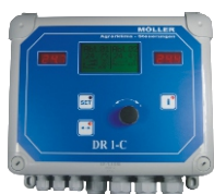
Digitální regulátor DR1-C