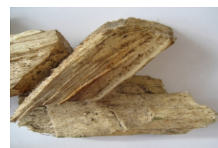
Měkké dřevo - kůrový substrát