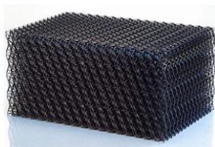
Plastové filtrační bloky