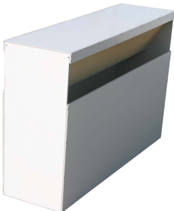
DZE 3A a DZE 3B