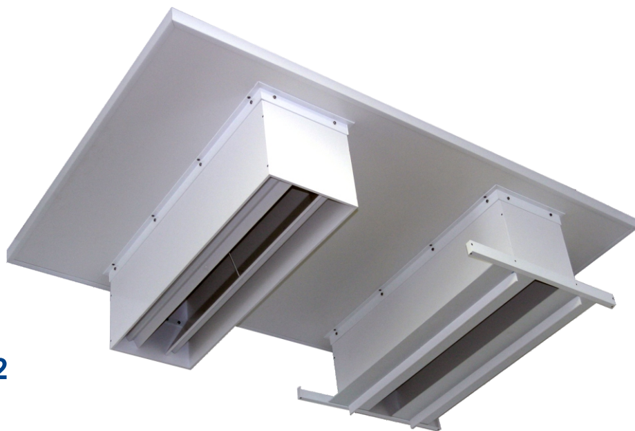
DZE 1 a DZE 2

Stropní přívodní klapky jsou vyrobeny z velmi odolné pěnovo-plastové desky. Klapky jsou určeny pro přívod vzduchu z mezistřešního prostoru v dlouhých sekcích. Vzduch se přivádí do obslužné uličky s plnou (nezarošтовanou) podlahou a hrazením z plného materiálu. Kromě vysoké účinnosti a spolehlivosti jsou tyto prvky charakteristické jednoduchou instalací a nízkými nároky na údržbu.